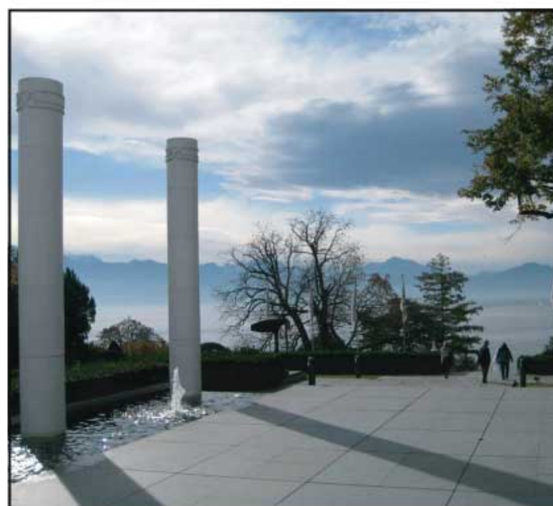
Blick über den Genfer See.