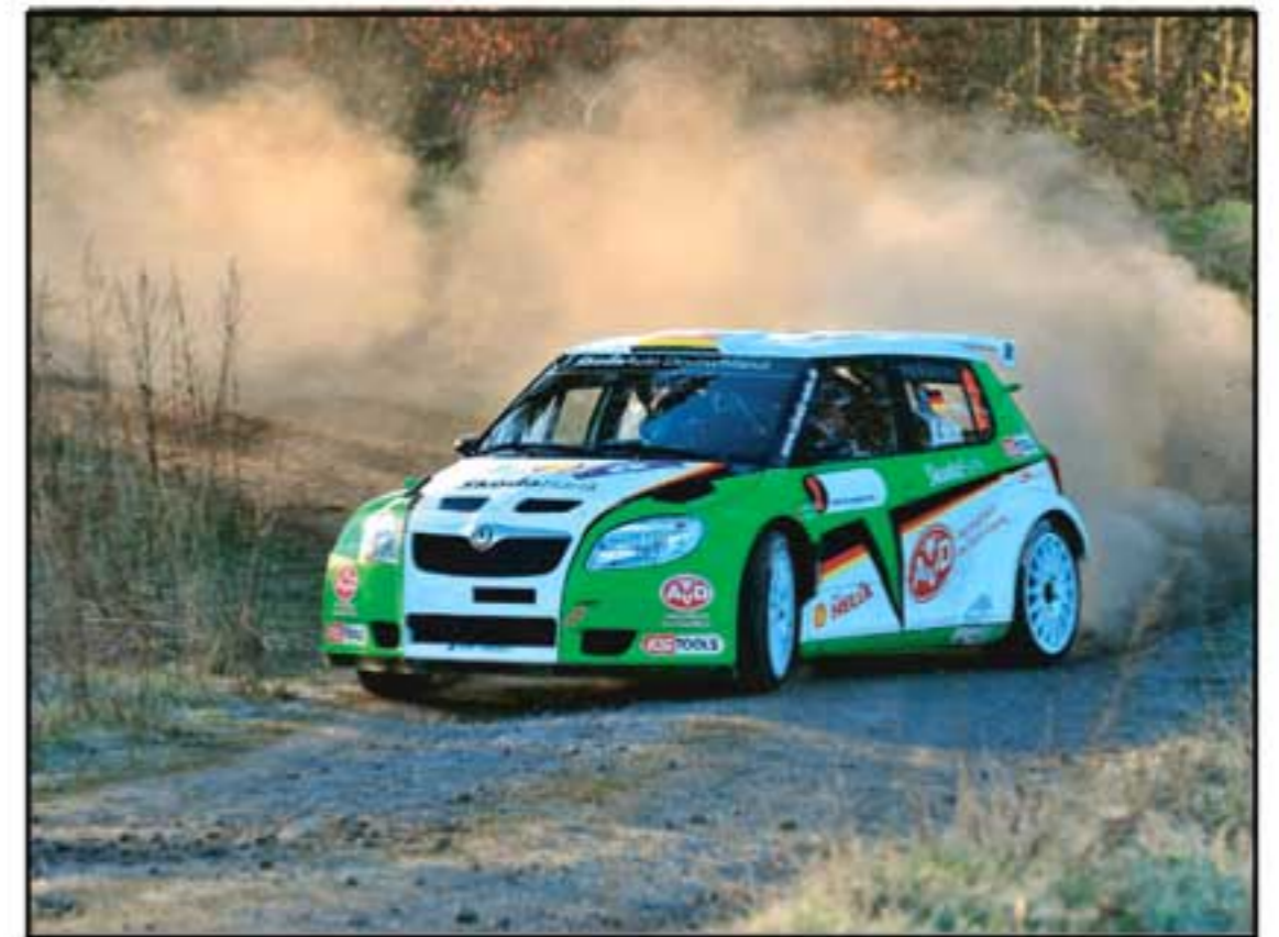
Den Sieg im Blick: Der Skoda Fabia S2000 in voller Fahrt.

Die Rallye gingen Kahle und Göbel konzentriert, chiropraktisch justiert, aber mit leicht