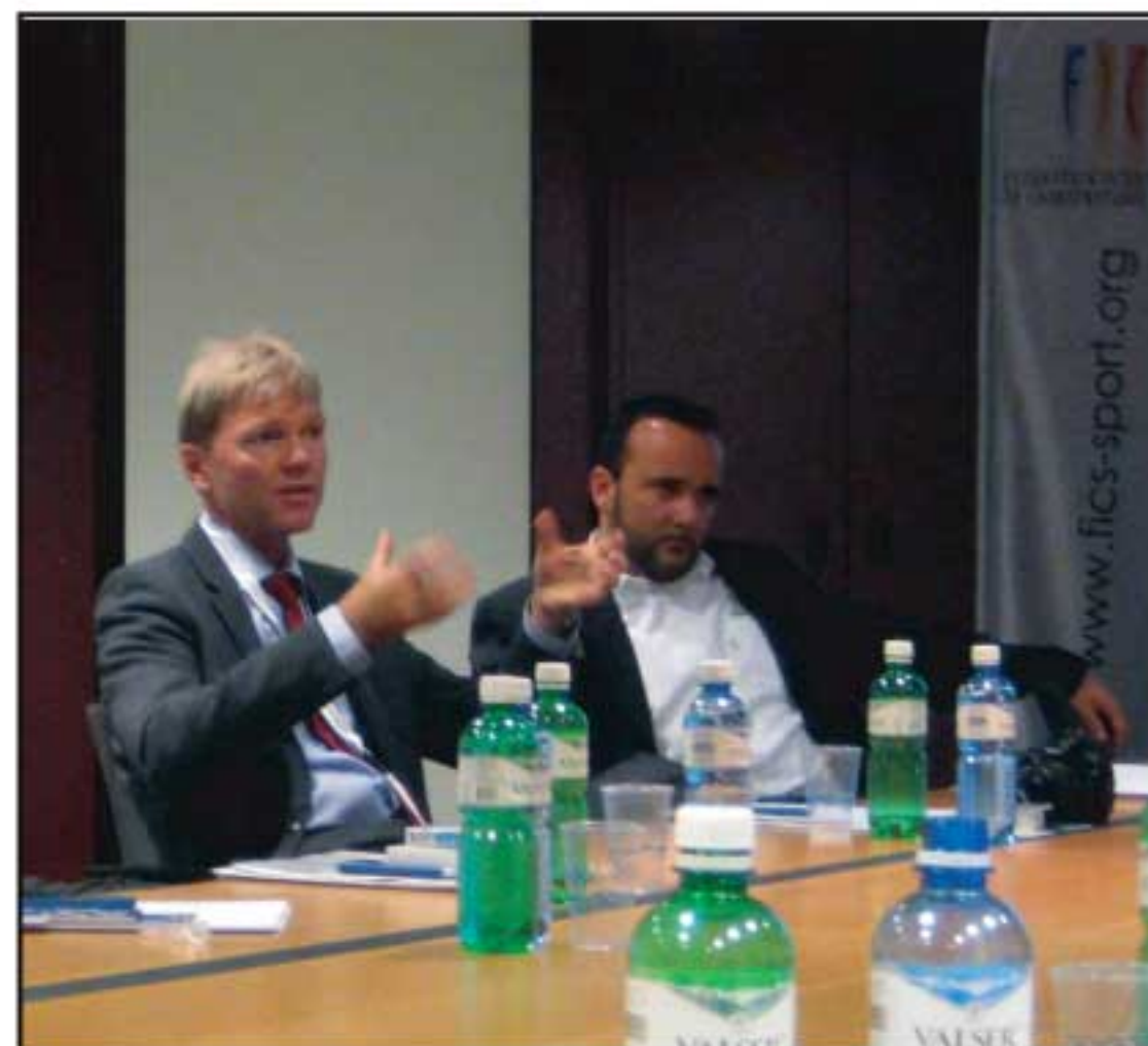
ECU president Øystein Ogre.

Das Treffen fand mit einem gemeinsamen Abendessen seinen Ausklang. Es war für alle Beteiligten eine interessante und lehrreiche Erfahrung, die hoffentlich im kommenden Jahr eine Fortsetzung findet.